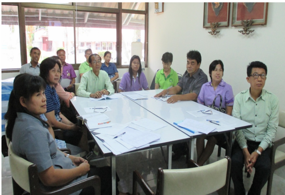
ภาพกิจกรรมการประชุมคณะกรรมการดำเนินการจัดประชุมนำเสนอผลงานฯ วันที่ 16 กันยายน 2558 ณ ห้องประชุม ตาตุ