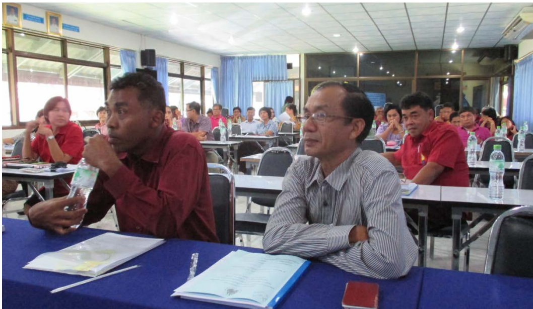
ผู้เข้าร่วมประชุมประกอบด้วยผู้บริหาร ครู และบุคลากรทางการศึกษา