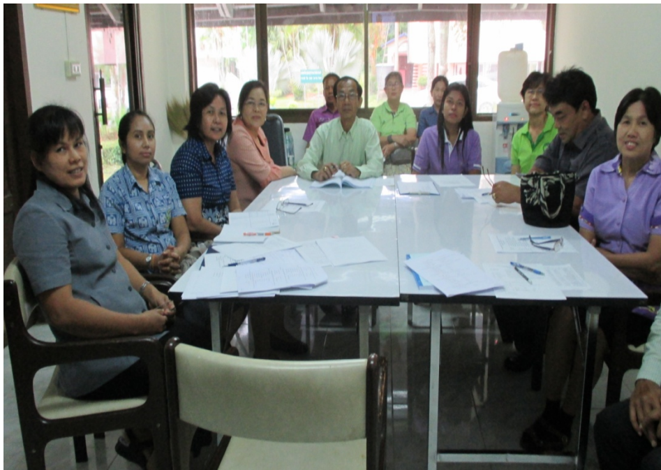
ภาพกิจกรรมการประชุมคณะกรรมการดำเนินการจัดประชุมนำเสนอผลงานฯ วันที่ 16 กันยายน 2558 ณ ห้องประชุม ตาตุ